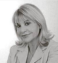
Η Πρόεδρος κ. Ντόρα Κασιμέρη

Η επίτευξη της επικύρωσης του Πρωτοκόλλου από ένα Κράτος (και τουλάχιστον δέκα στο σύνολο ώστε να αποκτήσει ισχύ διεθνούς νόμου), παρέχει τη δυνατότητα σε παιδιά, ομάδες παιδιών και αντιπροσώπους τους να απευθύνονται στα Ηνωμένα Έθνη, να υποβάλλουν παράπονα ή καταγγελίες για σοβαρές - συστηματικές παραβιάσεις των δικαιωμάτων τους, σε περιπτώσεις που αυτά δεν προστατεύονται επαρκώς από το Κράτος προέλευσής τους και έχουν εξαντληθεί όλα τα τοπικά διαθέσιμα μέσα για την αναζήτηση δικαιοσύνης.