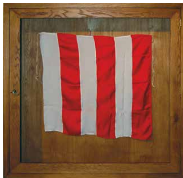
▲ Η παραδοσιακή ΦΟΤΑ του Συλλόγου μας που ο κοσμοναύτης Θεόδωρος Γουρτσίν Γραμματικόπουλος, για να δηλώσει και να τιμήσει την Ποντιακή του Καταγωγή, πήρε μαζί του στο διάστημα. Στις 12 Μαρτίου 2014, σε επίσημη εκδήλωση, την παρέδωσε στον πρόεδρο της Ένωσης Ποντίων Σουρμένων.