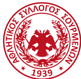
Αθλητικός Σύλλογος Σουρμένων