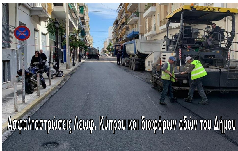
Ασφαλτοστρώσεις Λεωφ. Κύπρου και διαφόρων οδών του Δήμου