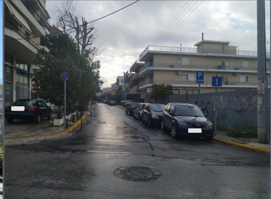
Λήψη 2/2020 : Στάθμευση μόνο στη δεξιά πλευρά

Οδός Χαλδείας (λήψη φωτογραφίας από Ροδοπόλεως προς Λ. Ιασωνίδου)