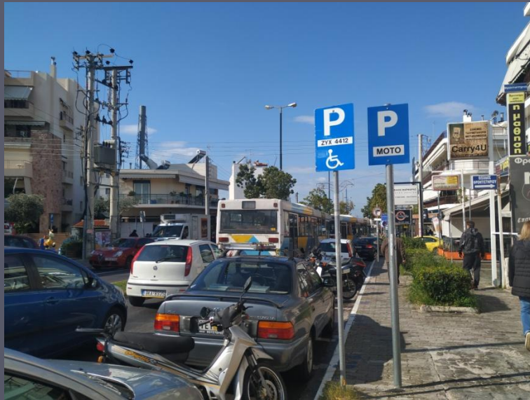
ΑΜΕΑ ΚΑΤΟΙΚΟΙ ΚΑΙ ΜΟΤΟ