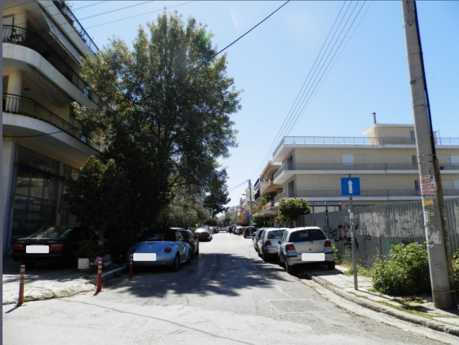
Λήψη 4/2015 : Στάθμευση εκατέρωθεν της οδού επί των πεζοδρομίων