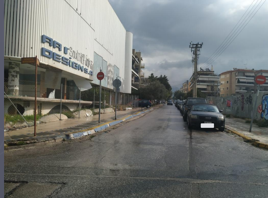
Λήψη 2/2020 : Στάθμευση μόνο στην αριστερή πλευρά

Οδός Ροδοπόλεως (λήψη φωτογραφίας από Παρ. Λ. Βουλιαγμένης)