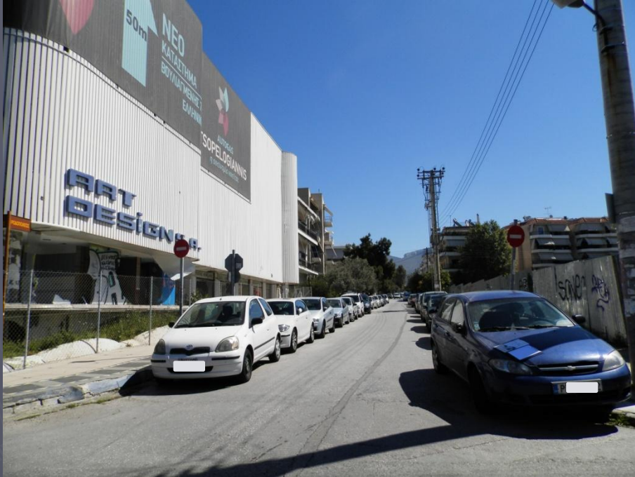
Λήψη 4/2015 : Στάθμευση εκατέρωθεν της οδού επί των πεζοδρομίων