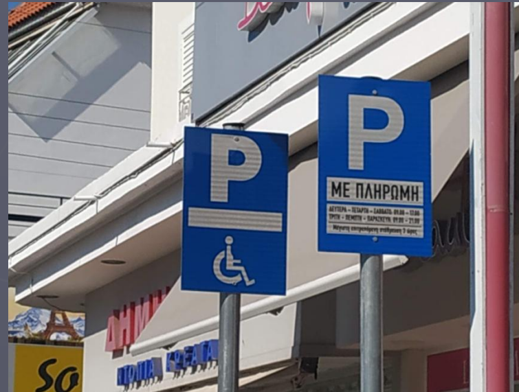
ΕΠΙΣΚΕΠΤΕΣ & ΑΜΕΑ ΕΠΙΣΚΕΠΤΕΣ